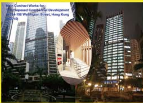
香港中環威靈頓街184-198號商廈(The Wellington)工程 (2015)