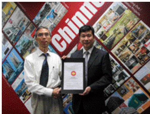
建業建築於2012年獲發ISO50001能源管理認證

環保節能已屬建築設計的大趨向，建業建築已領有環保管理(ISO14001)和能源管理(ISO50001)的證書。為針對所有綠建環評(BEAM Plus)的要求，建業建築在這些工程均會聘用專業環保顧問和環保主任，並會按合約要求將其分類：重要、必須、基本各等級，嚴格遵守。市場上，分判商過往仍抱抗拒環保施工要求的心態，皆因環保材料較貴，在採購物料和認證上也比較困難，但近年因綠色環保建材增多，加上已累積經驗，他們的接受性也已相應提升。