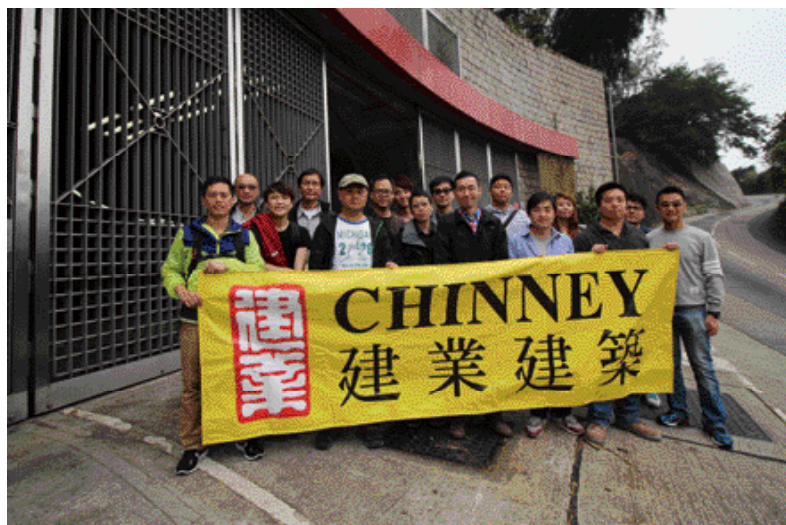
建業建築員工參觀赤柱污水處理廠

有見及建造業過往的高低潮，未來建業建築仍會抱平穩增長的方針來承接工程項目，貴精不貴多，用心專注承造適量工程項目，以能達至控制風險，務求令客戶滿意，達至雙贏局面。