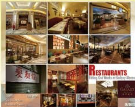
澳門銀河一期餐廳裝修工程 (2011)