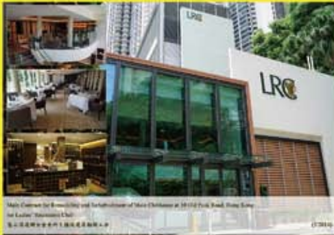
香港舊山頂道10號婦女會會所改建及裝修工程 (2014)