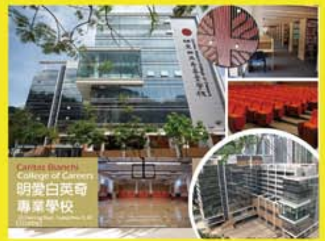
香港明愛白英奇專業學校工程 (2009)