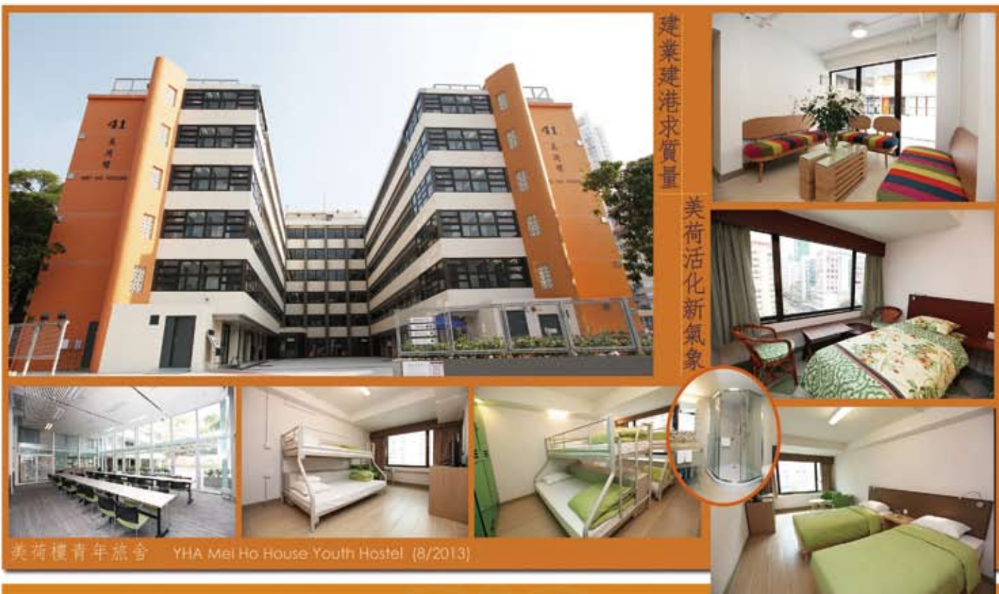
美荷樓青年旅舍 YHA Mei Ho House Youth Hostel (8/2013)