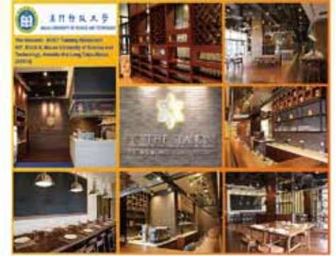
澳門科技大學廚藝餐廳裝修工程 (2013)