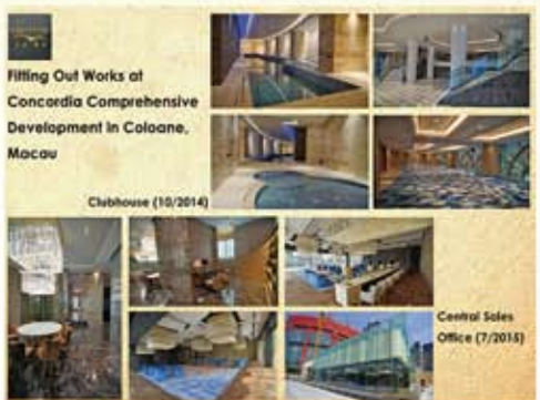
澳門金峰南岸會所裝修工程 (2013)