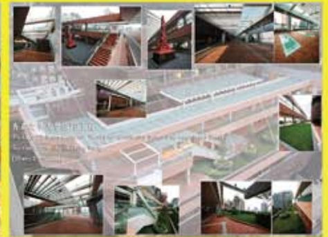
香港大學大學街2B工程 (2012)