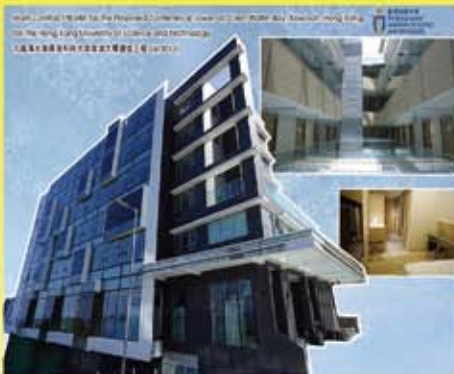
香港科技大學會議大樓工程 (2015)