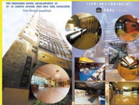
香港柯士甸路19-23號華麗酒店工程 (2012)