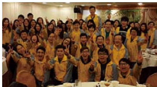
建業建築聖誕聯歡會