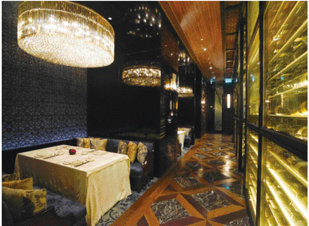
銀河娛樂渡假村 - 麗軒中菜廳裝修工程