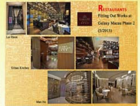
澳門銀河二期餐廳裝修工程 (2015)