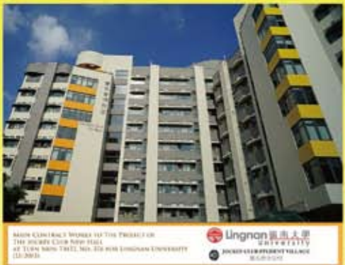
香港嶺南大學賽馬會宿舍工程 (2013)