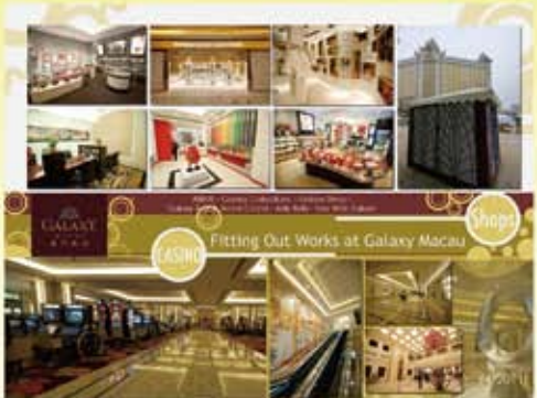
澳門銀河一期商場及賭場裝修工程 (2011)